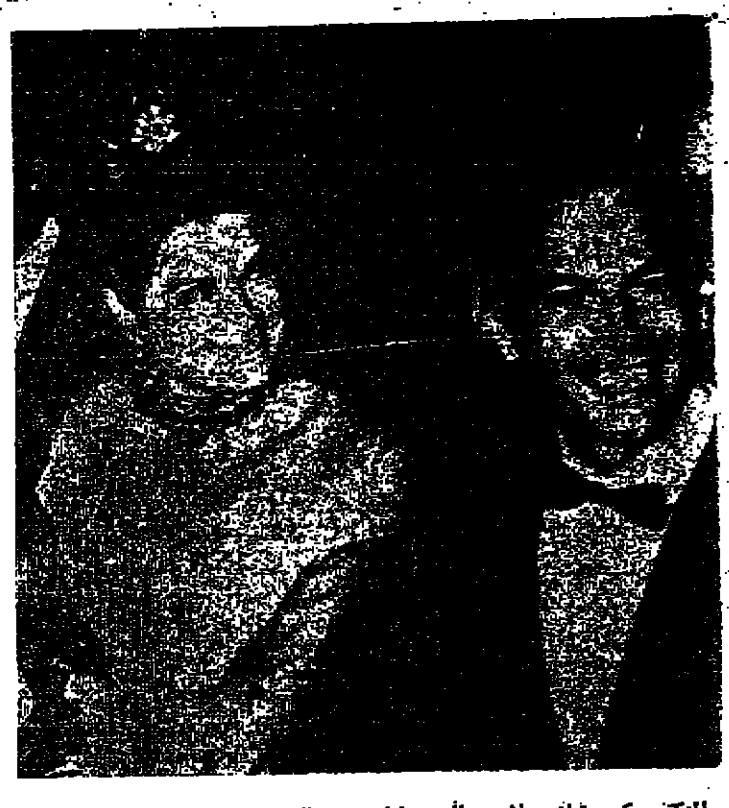
المكتور كريستيان برنارد والد عميلت زرع القلوب، مع الاجرة فريس اميرة مونكو اناه خلة الصليب الاحمر التي اقيمت في الامارة الصغيرة.